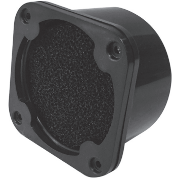
Figure 1. Microphone DM5